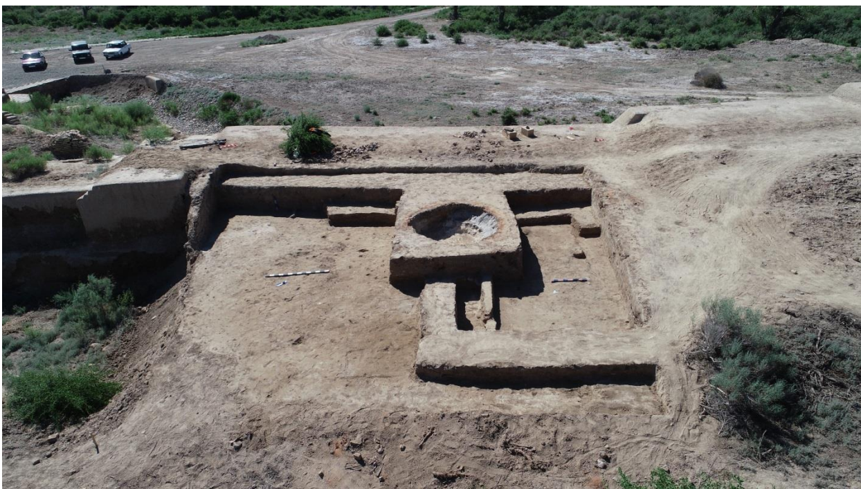
Сурет – 5. Құмырашылар шеберханасының әуеден көрініс.