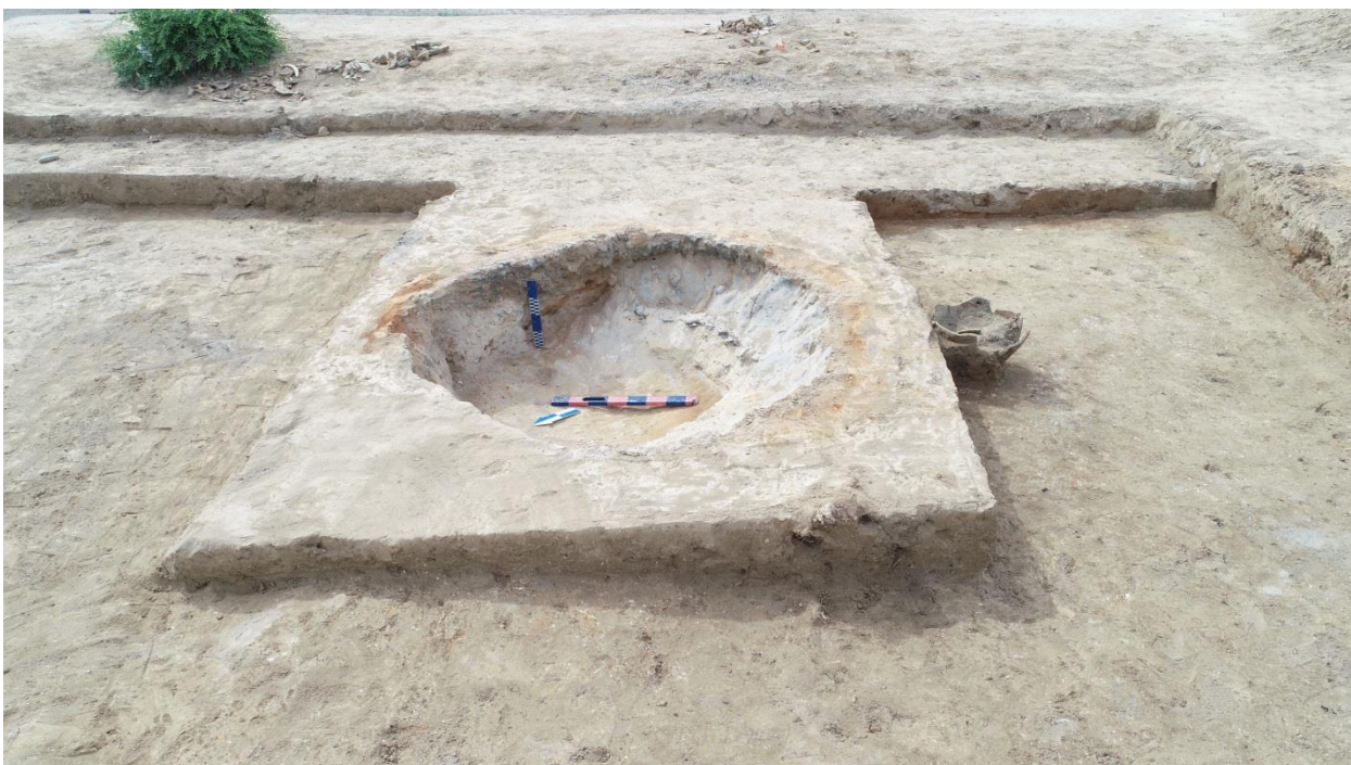
Сурет – 3. №1 пеш құмданның көрінісі.