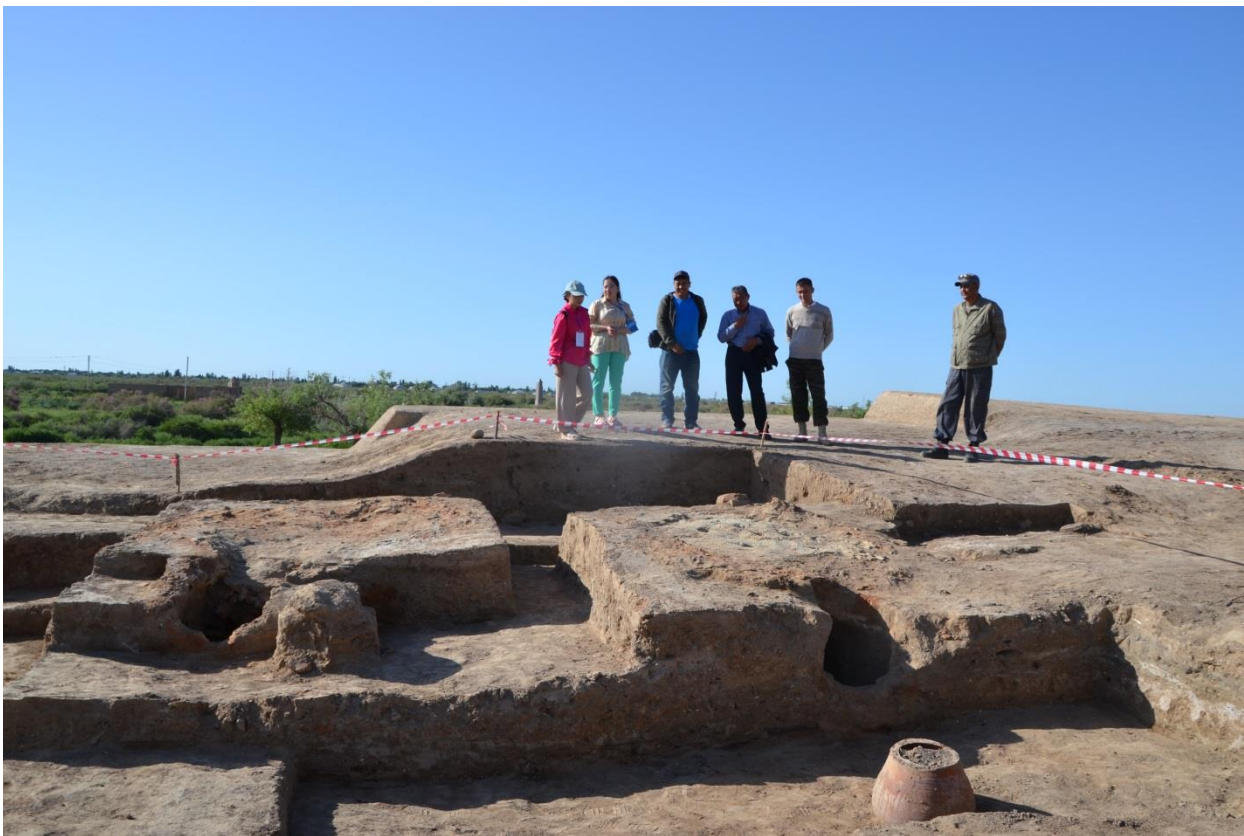
Сурет – 9. Құмырашылар шеберханасынан көрініс.