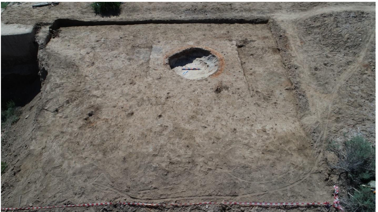
Сурет – 2. №1 пеш құмданның әуеден көрінісі.