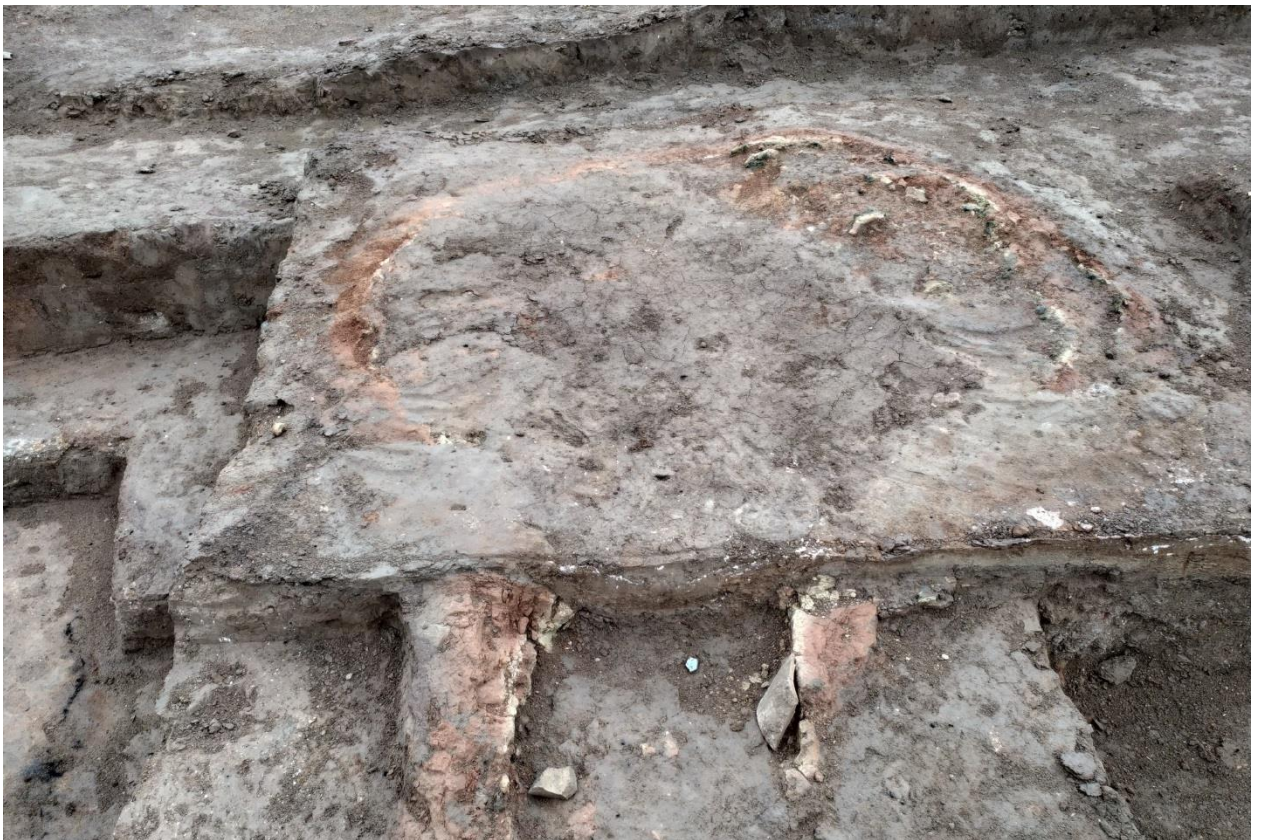
Сурет – 8. №2 пеш құмданның анықталу барысынан көрініс.