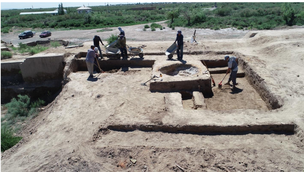
Сурет – 4. Қазба жұмысы барысынан көрініс.