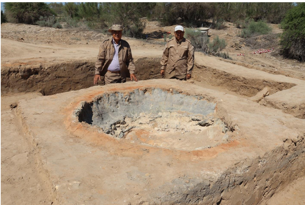
Сурет – 6. Құмырашылар шеберханасынан көрініс.