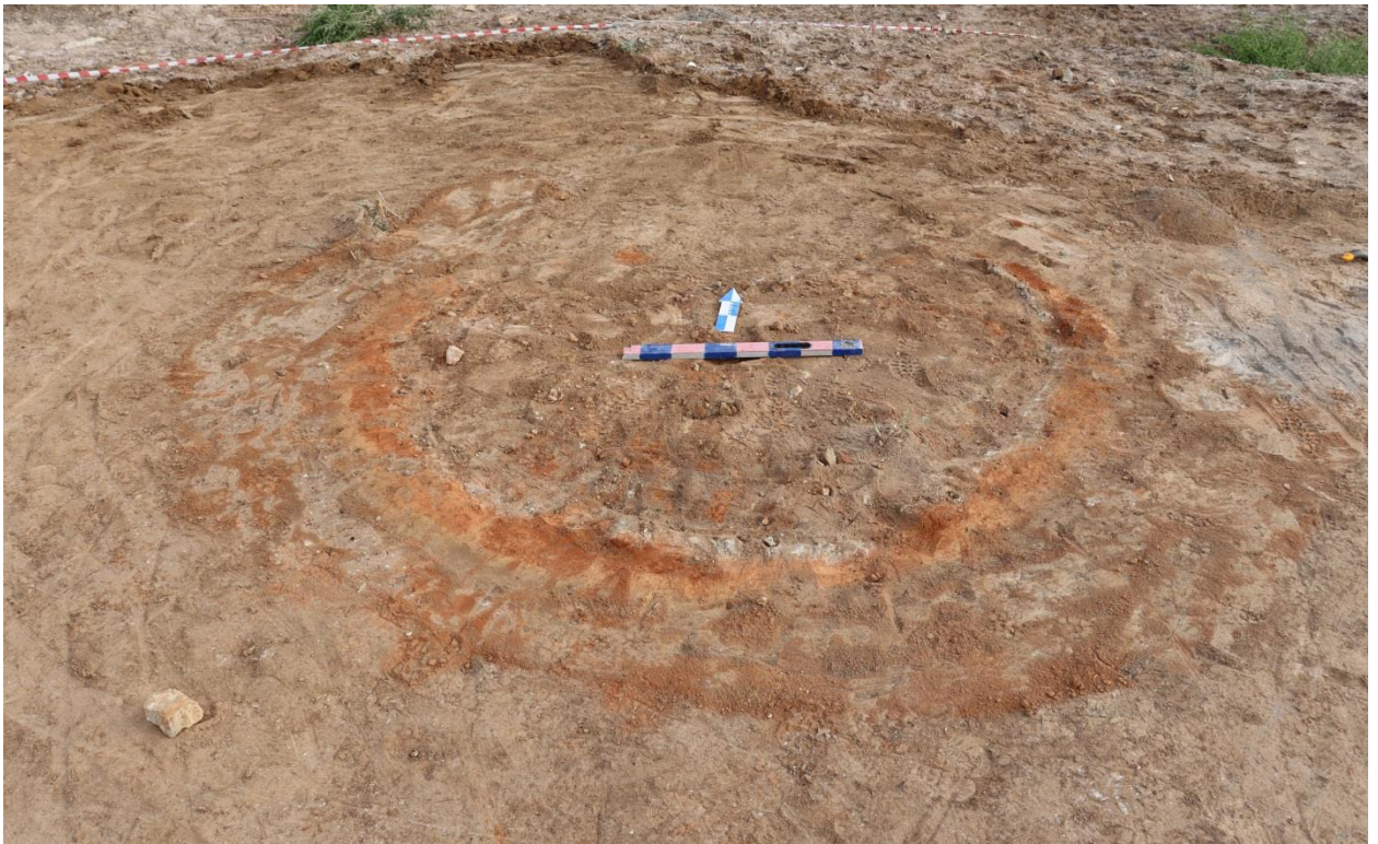
Сурет – 1. №1 пеш құмданның ашылу барысынан көрініс.